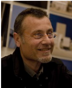
Foto. Come vi ho ripetuto varie volte il 25 febbraio è uscito in tutte le librerie d'Italia L'albero dei microchip , il nuovo VerdeNero firmato da Massimo Carlotto e Francesco Abate .

Un romanzo-inchiesta avvincente che tratta l'ecomafia più "al passo coi tempi" che vi sia in circolazione, ovvero quella legata al traffico internazionale di rifiuti elettronici .